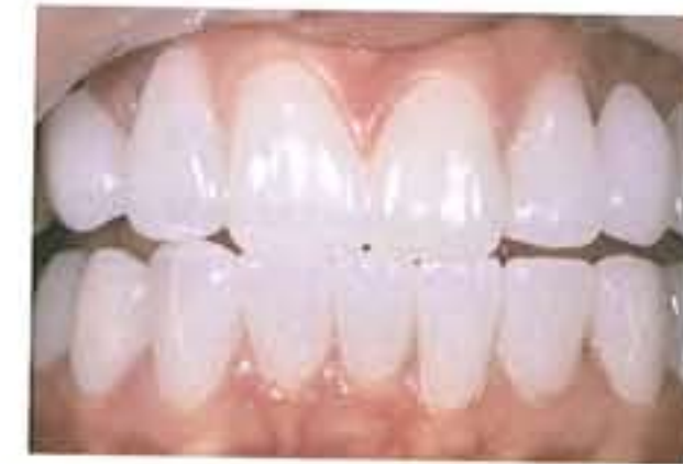
図7-19 KZR-CADジルコニアSHTの臨床例